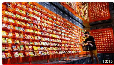
世界最大のセルフサービス！すごい即席めんコンビニ！ 9847 回視聴・1 年前 TRAVELICIOUS #ラーメン #麺類 #タイ ▶情報 世界最大のセルフサービス！すごい即席めんコンビニ 0.14 ~ 3.52 ... 4K 字幕