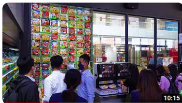
Trending on TikTok! Cambodia's First Self-Service Instant Ramen Machine 1.4万 回視聴・1 年前 Street Food TV We all love Food. Welcome to Street Food TV. Nice to see you here. [4K] Trending on Tik 4K 字幕