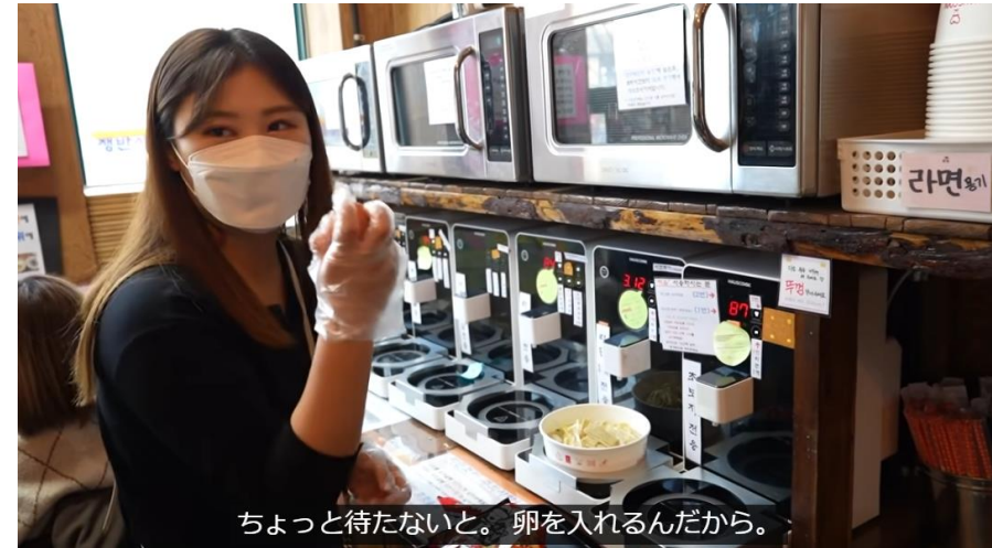
ちょっと待たないと。卵を入れるんだから。