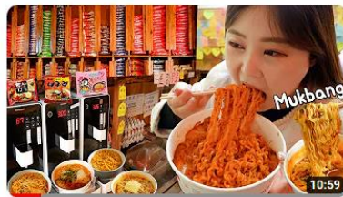
外食モッパン！ソウルのラーメン専用コンビニでいっぱい食べてきました！何でも あります〜😊 251万 回視聴・1 年前 까니짱 [G-NI: 蟹ちゃん] 皆さん〜明けましておめでとうございます〜🎉🎊🎆🎇🎆🎇 今年も元気で幸せに過ごせますように〜😊😊😊 この前行ってみたラ ーメンコンビニで 偶然日本人の方二人と ... 字幕