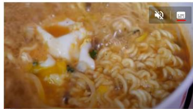
24H Ramen Convenience Store, Korean Instant Noodles - Korean Street Food [ASMR] 173万 回視聴・2 年前 D 딜라이트 Delight Thanks for watching! Delight is a channel that enjoys relaxation and pleasure through food. Enjoy your time. :) Subscribe ... 4K 字幕